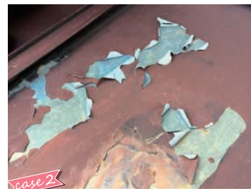
塗膜が剥がれて屋根の素地が見えている