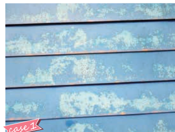
塗装が剥がれ、以前、塗り替えた塗膜が見えている

現 地調査に何うと、塗装が剥がれていたり、屋根の素地が見えていることがあります。この場合、適切な塗料を使用しないと下地との密着が悪く、塗膜剥離の原因となるので塗料選定が重要になります。弊社では塗料メーカーと連携し、一軒ごとに適切な塗料をご提案します。