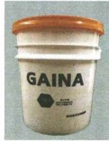
宇宙ロケットにも使われて。

良いところの「掛け算」で社員の強いところ、良いところを足し合せて、それらを掛け算して「二つの大きい力」にする。会社で仕事を進める時は、そんな活動の毎日です。これまで、社長の「足りない」ところを社員が補ってくれて、今のように会社が発展できたと思っています。