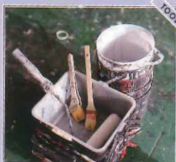
仕事に欠かせない相棒たち。使う塗料や道具もこだわっています。