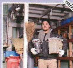
毎朝、その日の現場に合わせて持ち物をピックアップします。