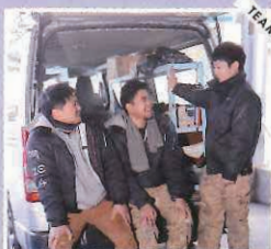
現場に合わせてチームで作業。先輩・後輩ともに頼れるメンバーです。