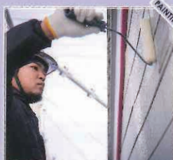
お客様の住宅での外壁塗装の作業。丁寧な作業が自慢です。