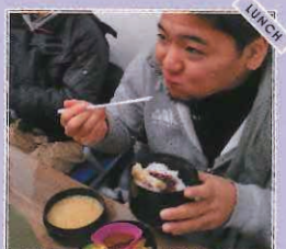
ランチは奥さんの手作り弁当。愛情たっぷりです午後も頑張れます。