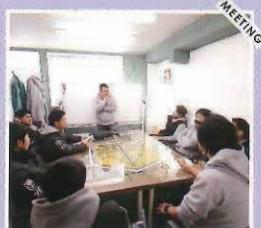
次の作業現場について、社長も交えたミーティングを実施します。